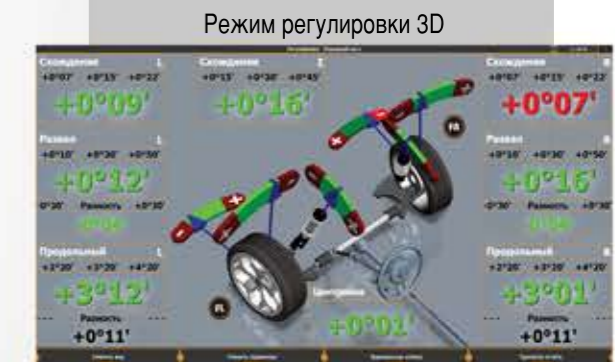
Визуализация 3D, 7 режимов