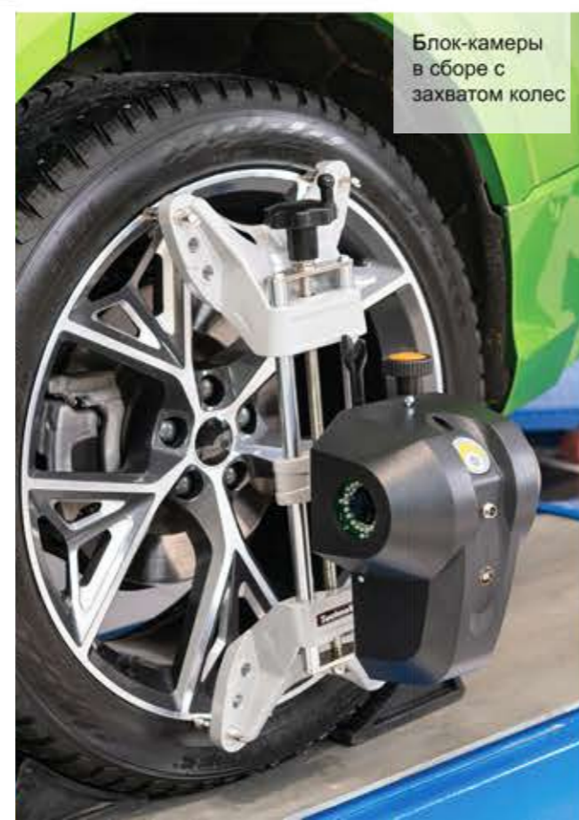
Блок-камеры в сборе с захватом колес