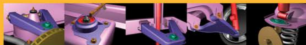
Режим компенсации "прокаткой" колеса