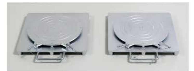
Поворотные платформы (комплект)