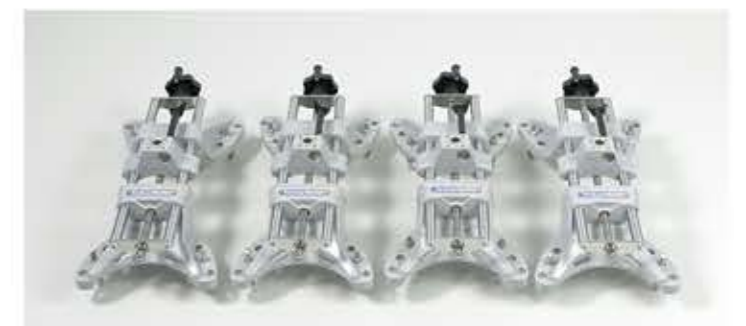
Колесные адаптеры (комплект)