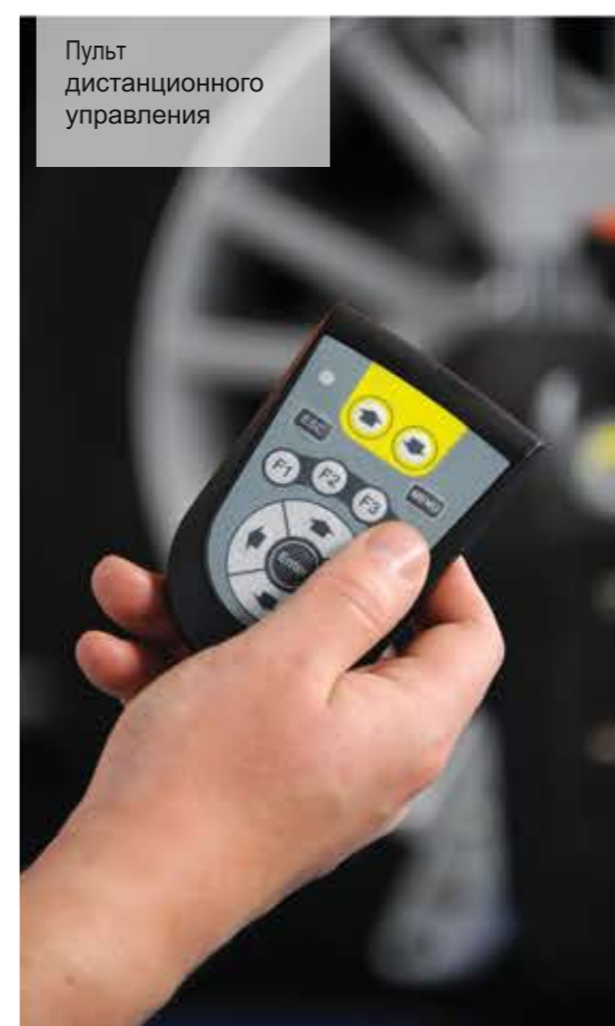
Пульт дистанционного управления