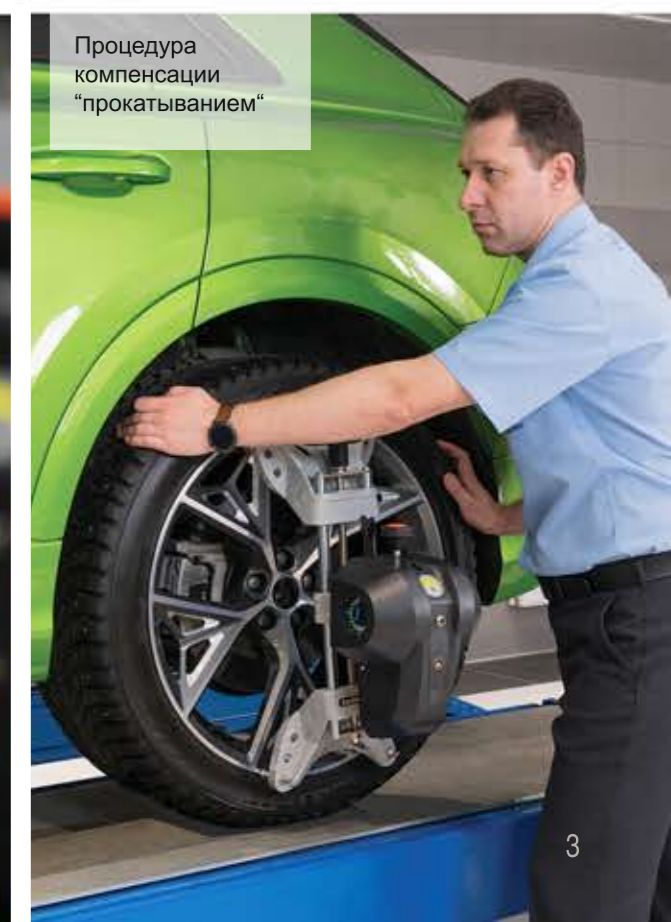
Процедура компенсации "прокатыванием"