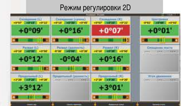
Визуализация 2D, 2 режима